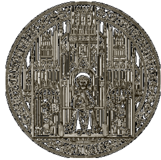
Το έμβλημα του Πανεπιστημίου της Χαϊλδεβέργης, το οποίο είναι το παλαιότερο πανεπιστήμιο της Γερμανίας

Η έλλειψη πόρων μπορεί εν μέρει να αντιμετωπισθεί και με την ενίσχυση της συνεργασίας ανάμεσα σε ακαδημαϊκά ιδρύματα. Σήμερα τα πανεπιστήμια που είναι σε θέση να διατηρούν ευρύ φάσμα τομέων -από την Αρχαιολογία έως την Ωκεανολογία- είναι ελάχιστα. Κανένα πανεπιστήμιο, ούτε στην Ευρώπη ούτε γενικά στον κόσμο, δεν εκπροσωπεί όλα τα γνωστικά πεδία. Εκείνα που είναι αναγκασμένα για οικονομικούς λόγους να περιορίζουν το φάσμα των αντικειμένων τους όλο και πληθαίνουν. Τα συνήθη θύματα των περικοπών είναι οι λεγόμενοι «μικροί» τομείς (μικροί ως προς τον αριθμό των φοιτητών και του προσωπικού, όχι ως προς το εύρος των δραστηριοτήτων τους), όπως π.χ. η ιστορία της ασιατικής τέχνης, οι βαλτικές γλώσσες και φιλολογίες, η μουσειολογία, η ασσυριολογία κτλ. Καθώς οι